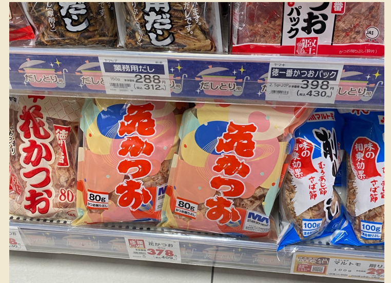
課外プロジェクト「かつお節パッケージデザインプロジェクト」（2021年11月～2022年3月）