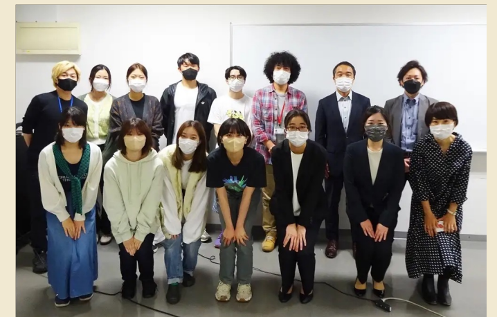
「証明写真機Ki-Re-iを活用した新ビジネス共創プロジェクト」 (2022年5月～9月)